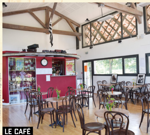
LE CAFÉ DE LA GARE